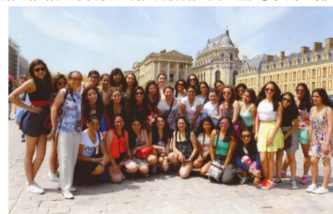
CHATEAU DE VERSAILLES

Y no podía faltar: El Palacio de Versailles se engalana al recibir la visita de las Jóvenes Quinceañeras y sus jardines son marco ideal para la foto del recuerdo.